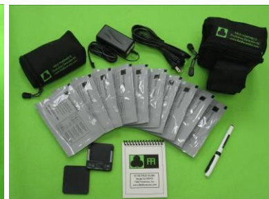
EL 1003 - Gürteltasche

Beratung und Vertrieb in Deutschland exklusiv durch: