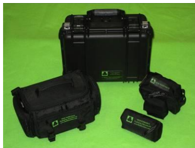
EL 1001 - Einsatzkoffer EL 1002 - Einsatz Tasche EL 1003 - Gürteltasche

Komplett- Lösungen, die optional auch mit dem Schnelltest EL 240 ausgestattet werden können: