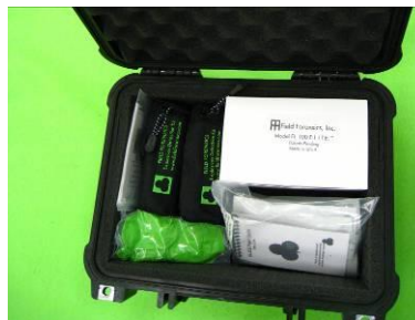
EL 1001 - Einsatzkoffer