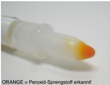
ORANGE = Peroxid-Sprengstoff erkannt!