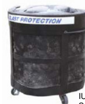
IU1200 nach dem Sprengtest

Anders als andere Produkte auf dem Markt, wurde der IU1200 – Behälter so konstruiert, dass er selbst Detonationen in Seiten- oder Bodennähe übersteht.