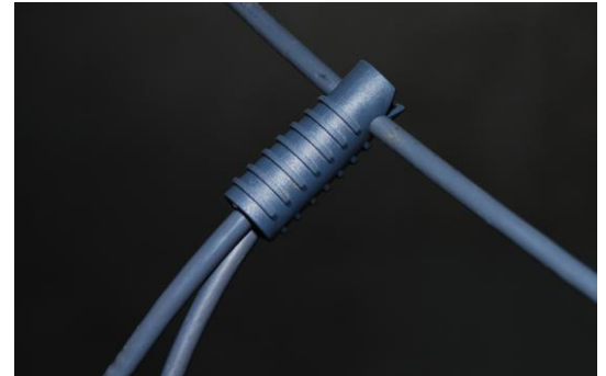
T-Verbindung mit DetCord Clip™

DetCord Clip™ Mini Bestellnummer: CX-DC2020 Liefermenge: 20 EA / Paket NATO Vers-Nr.: 1375-99-789-6461