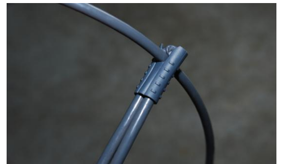
T-Verbindung mit DetCord Clip™ Mini